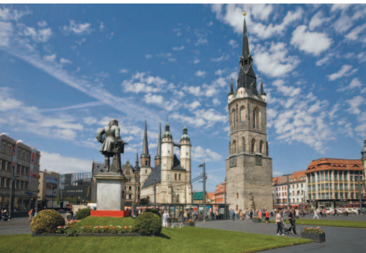
© Thomas Ziegler, Stadt Halle (Saale)